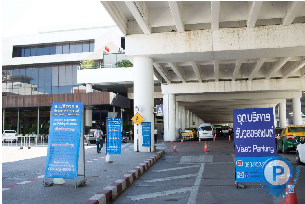
จุดรับรถเข้า ชั้น 1 ก่อนถึงประตู 1 Terminal 1 ก่อนถึงประตู 1