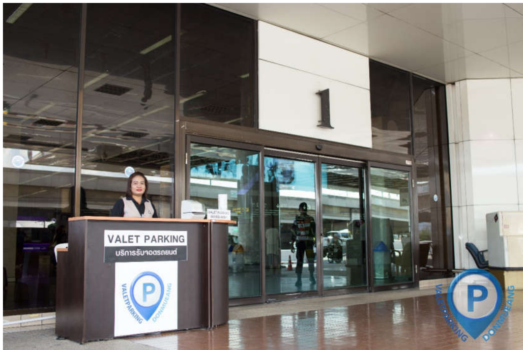
Counter รับรถเข้า ก่อนถึงประตู 1 Terminal 1